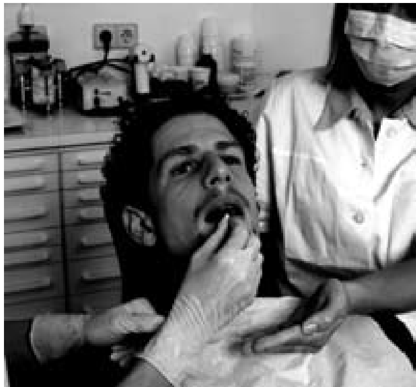
Soweit ein Zahnarzt günstigeren Zahnersatz bezieht, kann er dem Patienten auch lediglich den günstigeren Preis in Rechnung stellen.