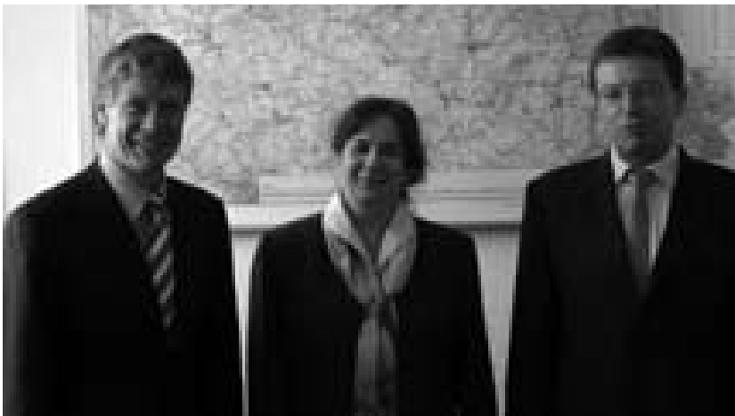
In offener und konstruktiver Atmosphäre gab es dennoch genügend Gelegenheit, auf die derzeitigen Probleme der Zahnärzteschaft aufmerksam zu machen.