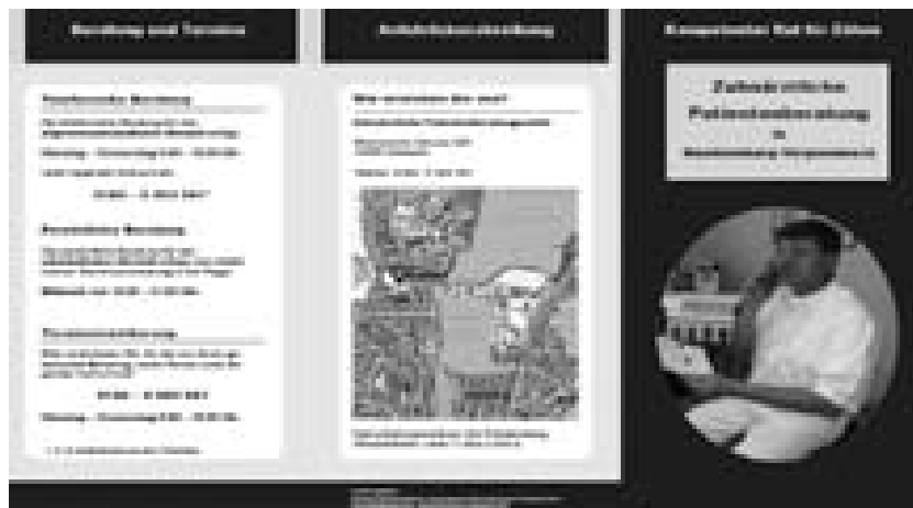
Ein Flyer macht auf die Arbeit der Patientenberatungsstelle im Haus der Heilberufe aufmerksam.