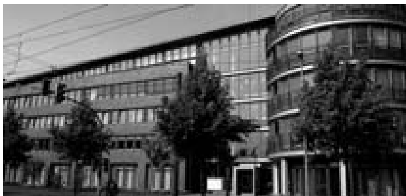
In der Kassenzahnärztlichen Vereinigung finden umfangreiche PC-Schulungen statt.